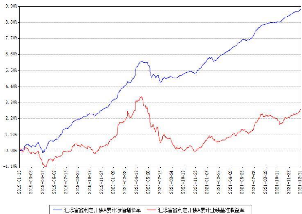
汇添富鑫利定开债A累计净值增长率与同期业绩基准收益率对比图