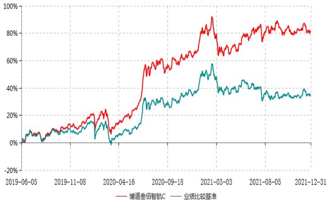
博道叁佰智航C累计净值增长率与业绩比较基准收益率历史走势对比图 (2019年06月05日-2021年12月31日)

注：本基金建仓期为自基金合同生效日起的6个月。截至建仓期结束，本基金各项资产配置比例符合基金合同及招募说明书有关投资比例的约定。