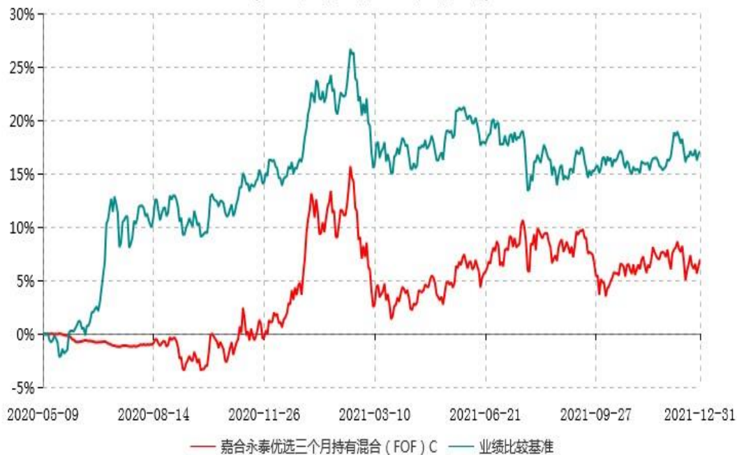
嘉合永泰优选三个月持有混合（FOF）C累计净值增长率与业绩比较基准收益率历史走势对比图 (2020年05月09日-2021年12月31日)