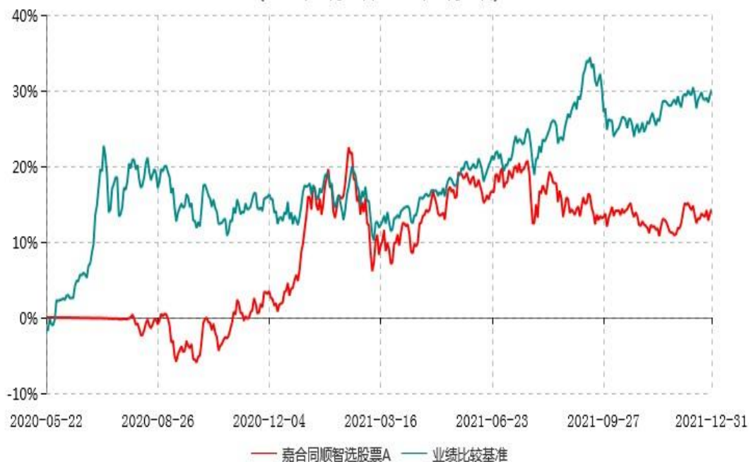
嘉合同顺智选股票A累计净值增长率与业绩比较基准收益率历史走势对比图 (2020年05月22日-2021年12月31日)