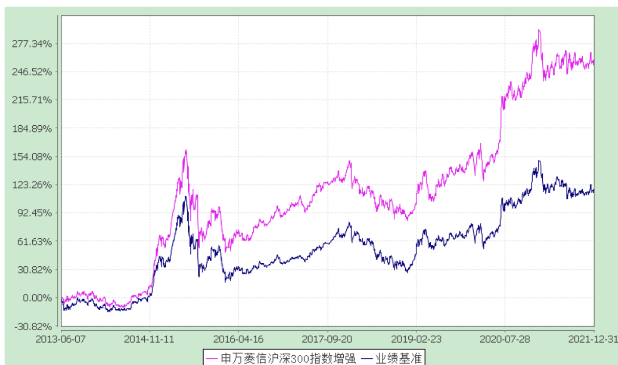
申万菱信沪深 300 指数增强 C