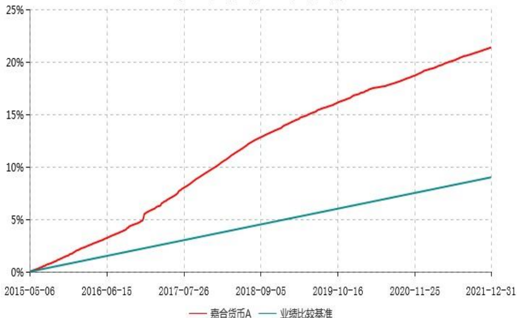
嘉合货币A累计净值收益率与业绩比较基准收益率历史走势对比图 (2015年05月06日-2021年12月31日)