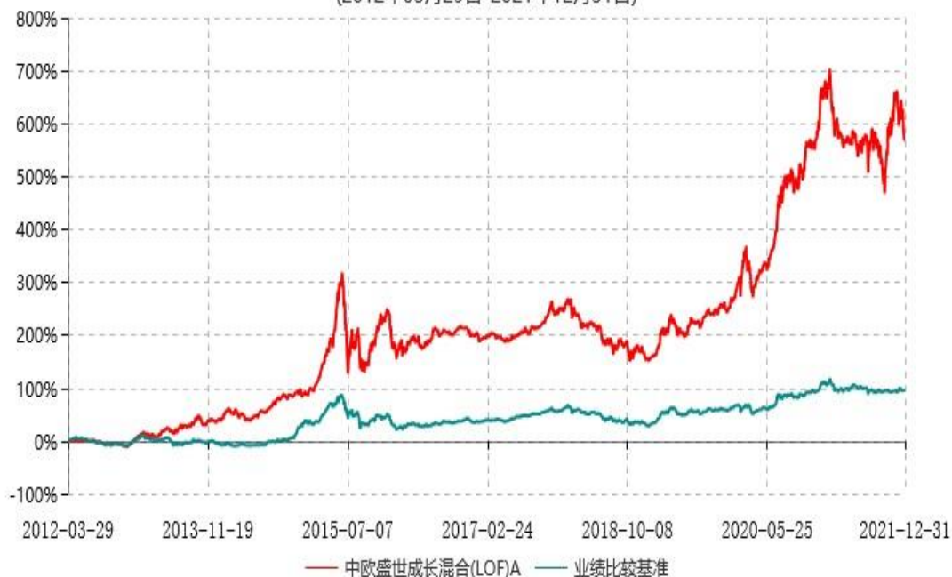
中欧盛世成长混合(LOF)A累计净值增长率与业绩比较基准收益率历史走势对比图 (2012年03月29日-2021年12月31日)