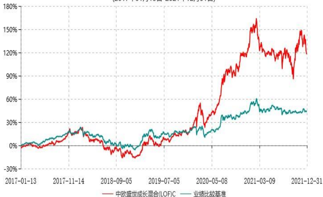
中欧盛世成长混合(LOF)C累计净值增长率与业绩比较基准收益率历史走势对比图 (2017年01月13日-2021年12月31日)

注：本基金于2017年1月12日新增C类份额，图示日期为2017年1月13日至2021年12月31日。