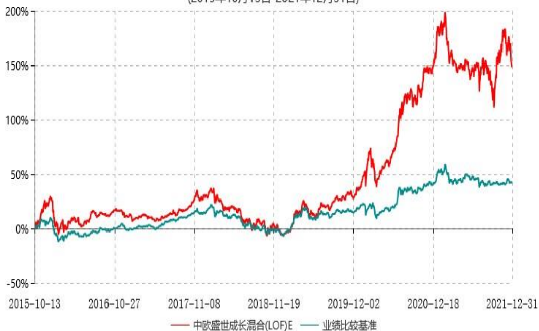
中欧盛世成长混合(LOF)E累计净值增长率与业绩比较基准收益率历史走势对比图 (2015年10月13日-2021年12月31日)

注：本基金于 2015 年 10 月 8 日新增 E 份额，图示日期为 2015 年 10 月 13 日至 2021 年 12 月 31 日。