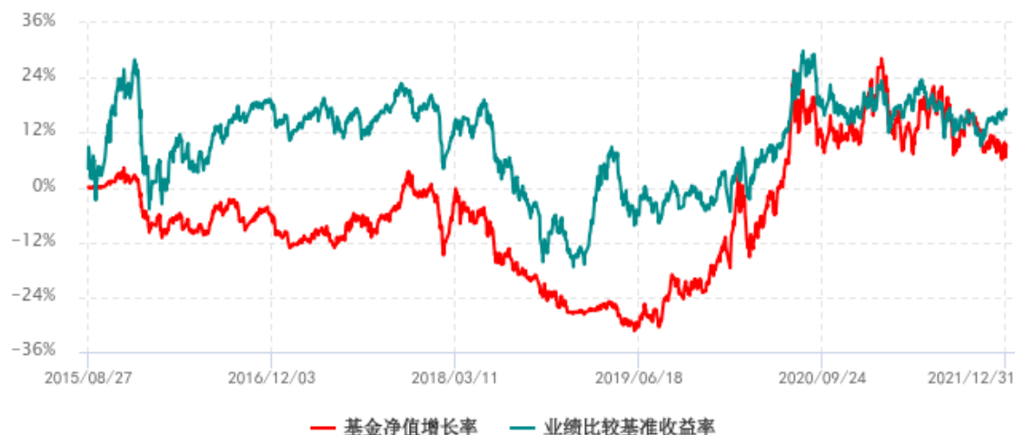
基金份额累计净值增长率与同期业绩比较基准收益率历史走势对比图 (2015年08月27日-2021年12月31日)