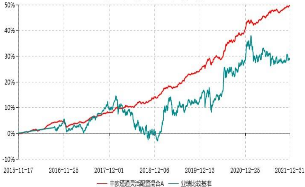
中欧瑾通灵活配置混合A累计净值增长率与业绩比较基准收益率历史走势对比图 (2015年11月17日-2021年12月31日)

注：自 2016 年 9 月 5 日起，业绩比较基准由金融机构人民币三年期定期存款基准利率（税后）变更至沪深 300 指数收益率*50%+中债综合指数收益率*50%。