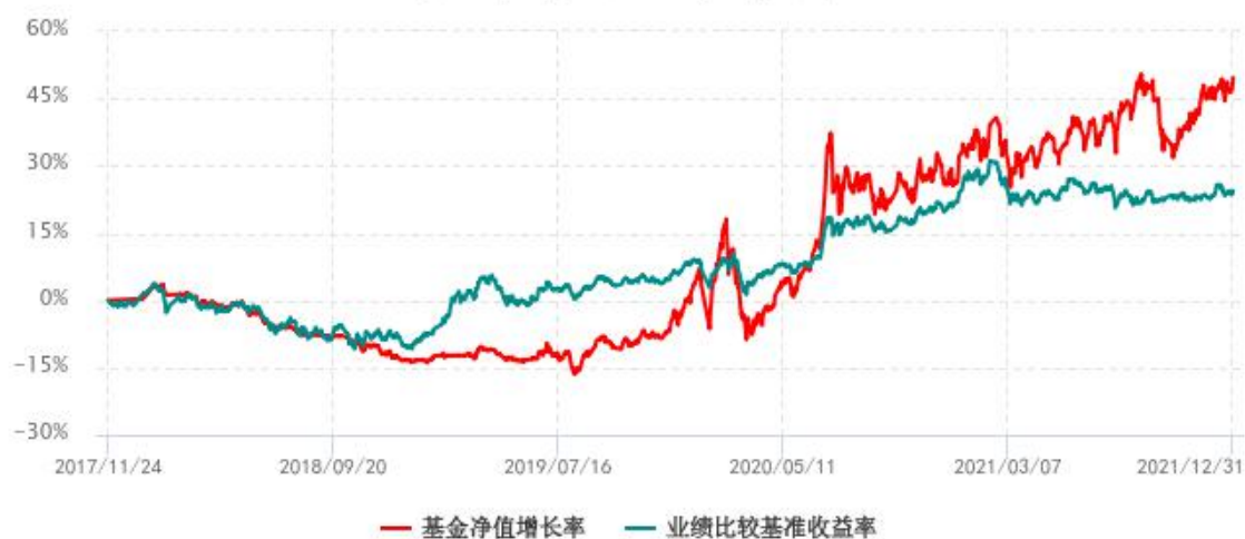
基金份额累计净值增长率与同期业绩比较基准收益率历史走势对比图 (2017年11月24日-2021年12月31日)