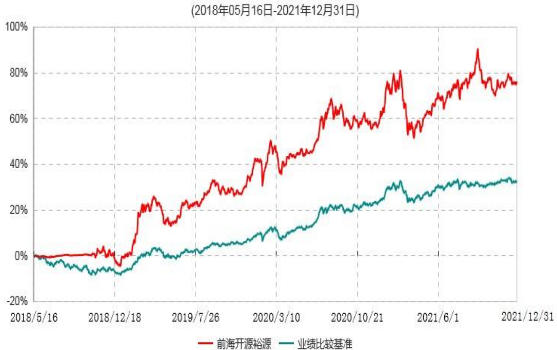
前海开源裕源混合型基金中基金（FOF）累计净值增长率与业绩比较基准收益率历史走势对比图