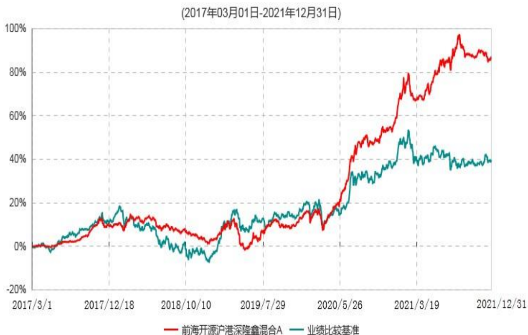
前海开源沪港深隆鑫混合A累计净值增长率与业绩比较基准收益率历史走势对比图