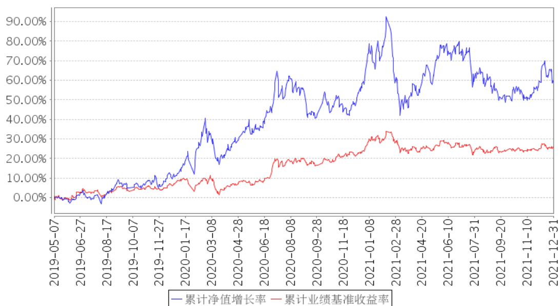
长城久润混合累计净值增长率与同期业绩比较基准收益率的历史走势对比图

注：①本基金合同规定本基金股票等权益类投资占基金资产的比例范围为 0-95%，债券等固定收益类投资占基金资产的比例范围为 0-95%；现金或者到期日在 1 年以内的政府债券不低于基金资产净值的 5%，其中，现金类资产不包括结算备付金、存出保证金、应收申购款。