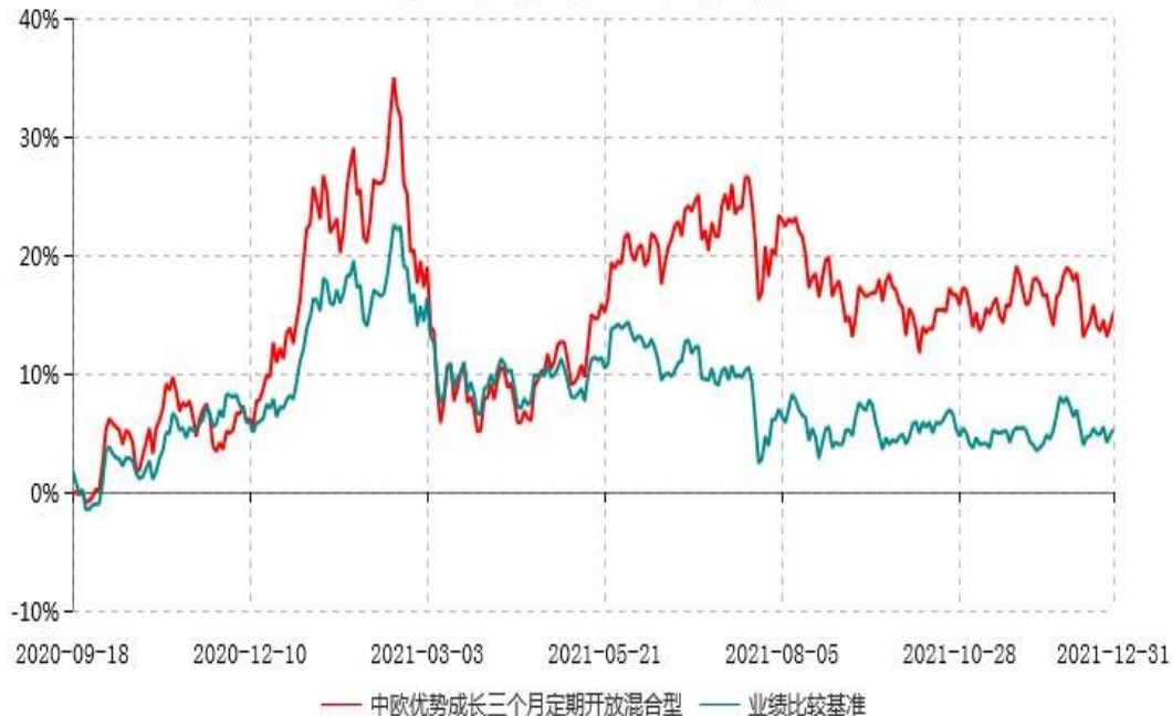
中欧优势成长三个月定期开放混合型发起式证券投资基金累计净值增长率与业绩比较基准收益率历史走势对比图 (2020年09月18日-2021年12月31日)

注：本基金基金合同生效日期为2020年9月18日，按基金合同的规定，本基金自基金合同生效起六个月为建仓期，建仓期结束时各项资产配置比例已符合基金合同约定。