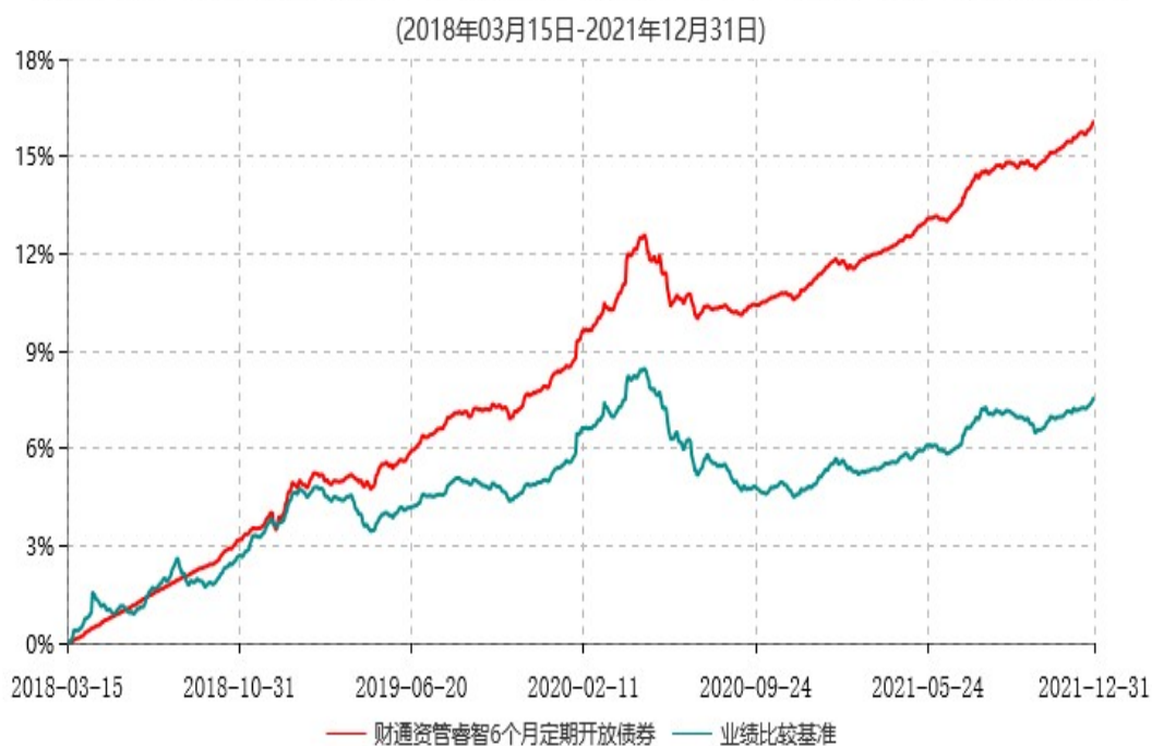
财通资管睿智6个月定期开放债券型发起式证券投资基金累计净值增长率与业绩比较基准收益率历史走势对比图

注：自基金合同生效至报告期末，财通资管睿智6个月定期开放债券基金份额净值增长率为16.07%，同期业绩比较基准收益率为7.56%。