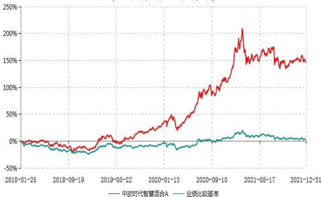
中欧时代智慧混合A累计净值增长率与业绩比较基准收益率历史走势对比图 (2018年01月25日-2021年12月31日)