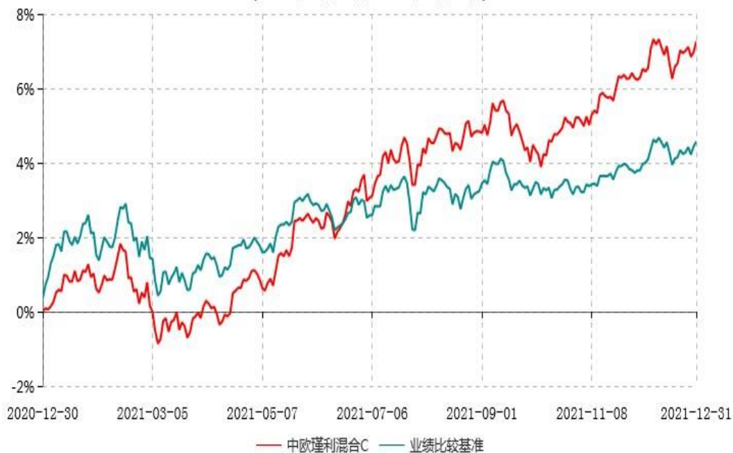
中欧瑾利混合C累计净值增长率与业绩比较基准收益率历史走势对比图 (2020年12月30日-2021年12月31日)

注：本基金基金合同生效日期为 2020 年 12 月 30 日，按基金合同的规定，本基金自基金合同生效起六个月为建仓期，建仓期结束时各项资产配置比例已符合基金合同约定。