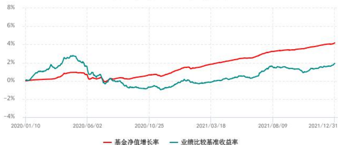
基金份额累计净值增长率与同期业绩比较基准收益率历史走势对比图 (2020年01月10日-2021年12月31日)

注：1、本基金成立于 2020 年 1 月 10 日； 2、比较基准为：中债综合全价（总值）指数收益率。