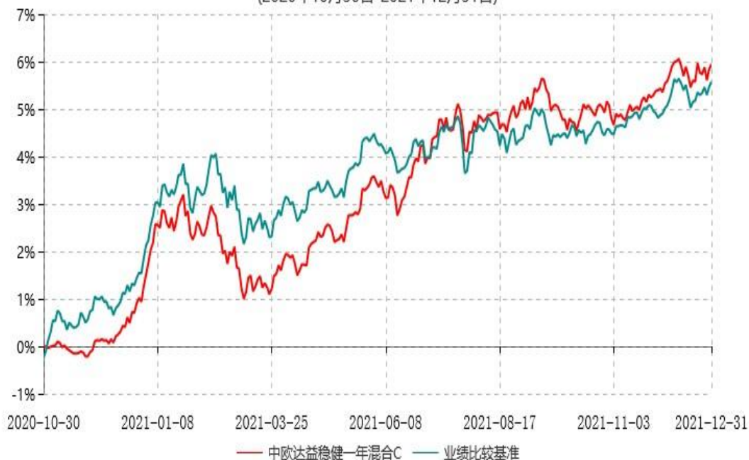
中欧达益稳健一年混合C累计净值增长率与业绩比较基准收益率历史走势对比图 (2020年10月30日-2021年12月31日)

注：本基金基金合同生效日期为2020年10月30日，按基金合同的规定，本基金自基金合同生效起六个月为建仓期，建仓期结束时各项资产配置比例已符合基金合同约定。