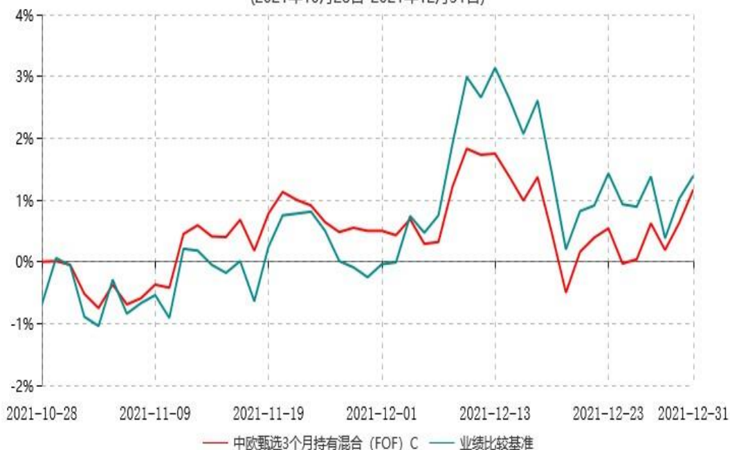
中欧甄选3个月持有混合（FOF）C累计净值增长率与业绩比较基准收益率历史走势对比图 (2021年10月28日-2021年12月31日)

注：本基金基金合同生效日期为 2021 年 10 月 28 日，自基金合同生效日起到本报告期末不满一年，按基金合同的规定，本基金自基金合同生效起六个月为建仓期，建仓期结束时各项资产配置比例应当符合基金合同约定。