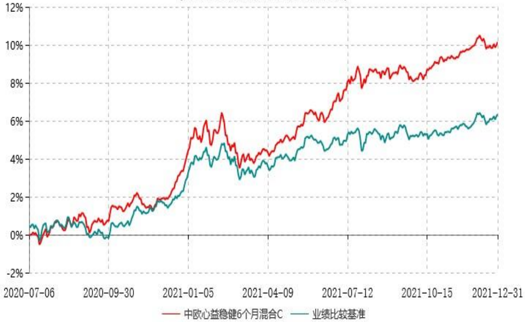
中欧心益稳健6个月混合C累计净值增长率与业绩比较基准收益率历史走势对比图 (2020年07月06日-2021年12月31日)

注：本基金基金合同生效日期为 2020 年 7 月 6 日，按基金合同的规定，本基金自基金合同生效起六个月为建仓期，建仓期结束时各项资产配置比例已符合基金合同约定。