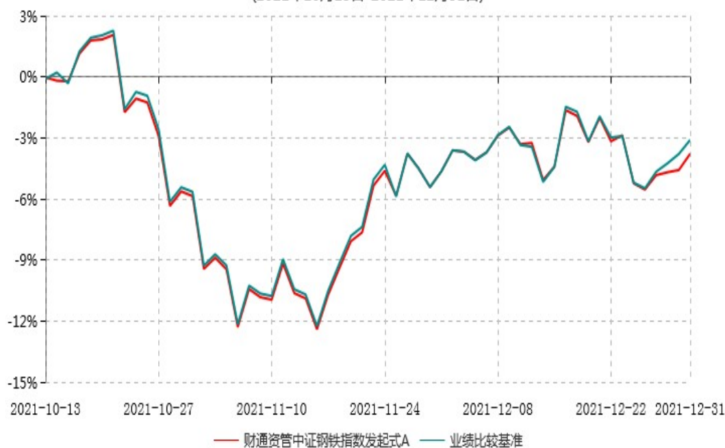
财通资管中证钢铁指数发起式A累计净值增长率与业绩比较基准收益率历史走势对比图 (2021年10月13日-2021年12月31日)