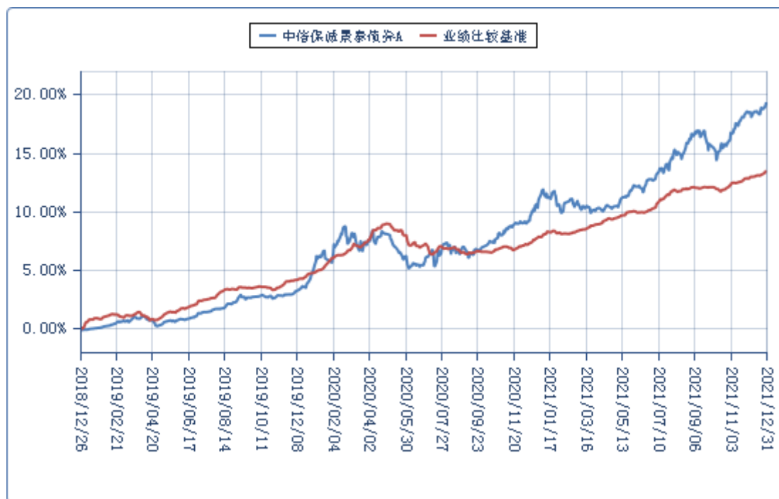
中信保诚景泰债券 C