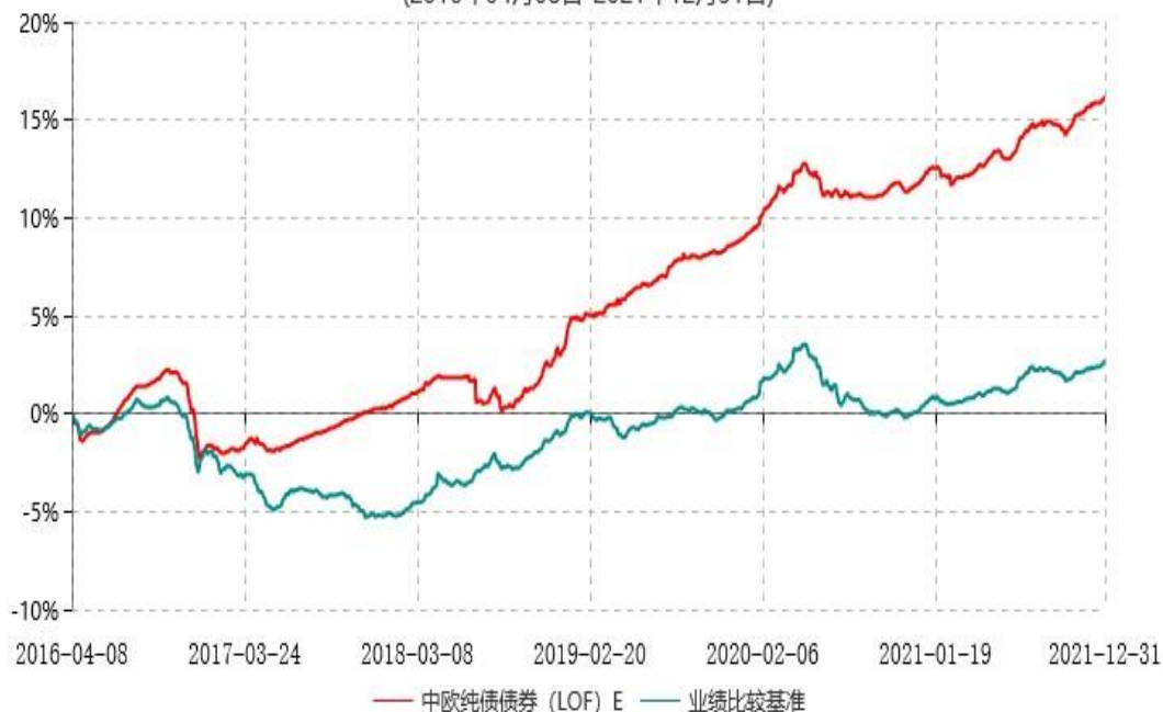
中欧纯债债券 (LOF) E 累计净值增长率与业绩比较基准收益率历史走势对比图 (2016年04月08日-2021年12月31日)

注：自 2016 年 4 月 6 日起，本基金新增 E 类份额，图示日期为 2016 年 4 月 8 日至 2021 年 12 月 31 日。