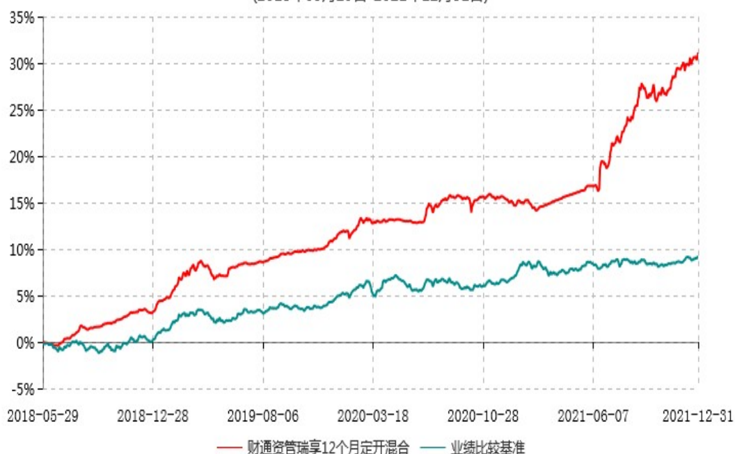
财通资管瑞享12个月定期开放混合型证券投资基金累计净值增长率与业绩比较基准收益率历史走势对比图 (2018年05月29日-2021年12月31日)

注：自基金合同生效至报告期末，财通资管瑞享12个月定开混合基金份额净值增长率为31.14%，同期业绩比较基准收益率为9.19%。