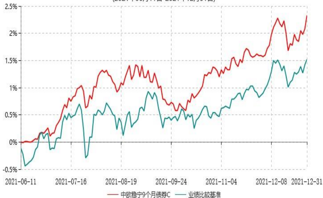
中欧稳宁9个月债券C累计净值增长率与业绩比较基准收益率历史走势对比图 (2021年06月11日-2021年12月31日)

注：本基金基金合同生效日期为2021年6月11日，自基金合同生效日起到本报告期末不满一年，按基金合同的规定，本基金自基金合同生效起六个月为建仓期，建仓期结束时各项资产配置比例已符合基金合同约定。