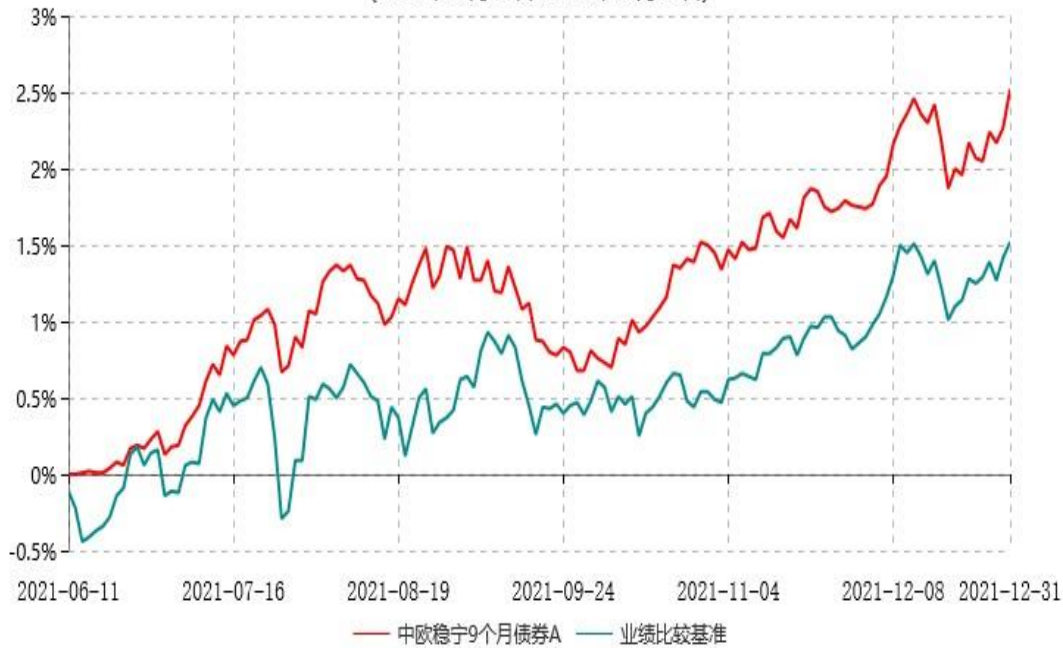
中欧稳宁9个月债券A累计净值增长率与业绩比较基准收益率历史走势对比图 (2021年06月11日-2021年12月31日)

注：本基金基金合同生效日期为2021年6月11日，自基金合同生效日起到本报告期末不满一年，按基金合同的规定，本基金自基金合同生效起六个月为建仓期，建仓期结束时各项资产配置比例已符合基金合同约定。