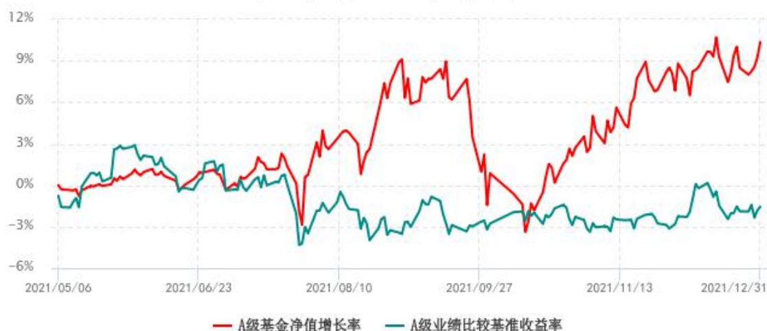
A 级基金份额累计净值增长率与同期业绩比较基准收益率历史走势对比图 (2021 年 05 月 06 日-2021 年 12 月 31 日)