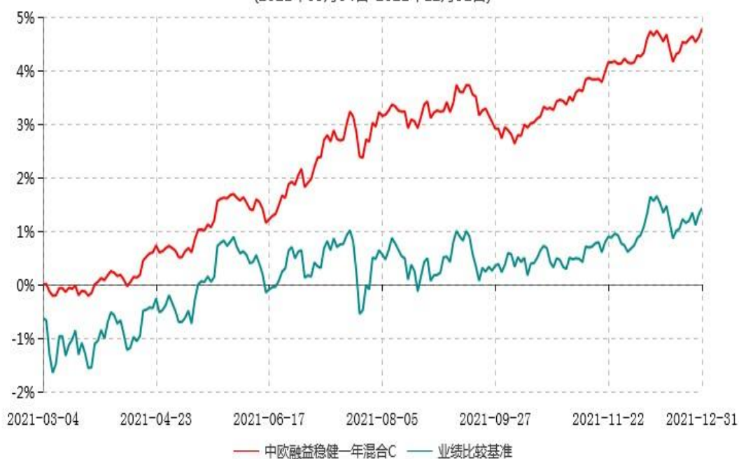
中欧融益稳健一年混合C累计净值增长率与业绩比较基准收益率历史走势对比图 (2021年03月04日-2021年12月31日)

注：本基金基金合同生效日期为 2021 年 3 月 4 日，自基金合同生效日起到本报告期末不满一年，按基金合同的规定，本基金自基金合同生效起六个月为建仓期，建仓期结束时各项资产配置比例已符合基金合同约定。