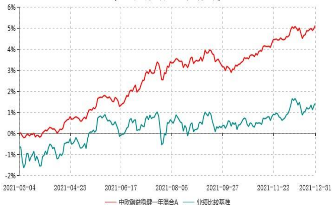
中欧融益稳健一年混合A累计净值增长率与业绩比较基准收益率历史走势对比图 (2021年03月04日-2021年12月31日)

注：本基金基金合同生效日期为 2021 年 3 月 4 日，自基金合同生效日起到本报告期末不满一年，按基金合同的规定，本基金自基金合同生效起六个月为建仓期，建仓期结束时各项资产配置比例已符合基金合同约定。