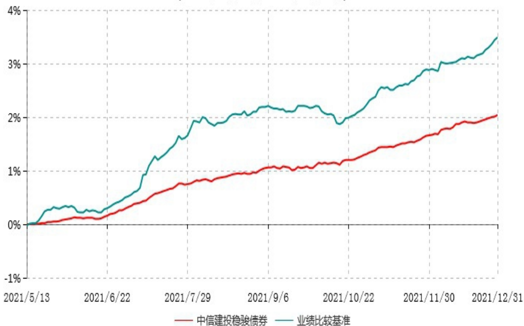
中信建投稳骏一年定期开放债券型发起式证券投资基金累计净值增长率与业绩比较基准收益率历史走势对比图 (2021年05月13日-2021年12月31日)

注：1、本基金基金合同生效于2021年5月13日，截至报告期末本基金基金合同生效未满一年。