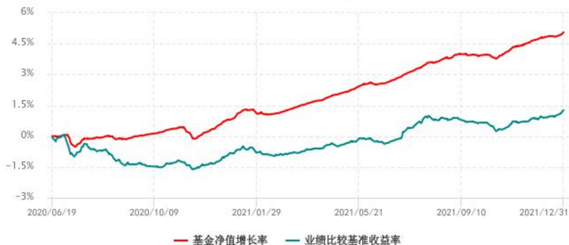
基金份额累计净值增长率与同期业绩比较基准收益率历史走势对比图 (2020年06月19日-2021年12月31日)

注：1、本基金成立于 2020 年 6 月 19 日；2、比较基准：中债综合全价（总值）指数收益率。