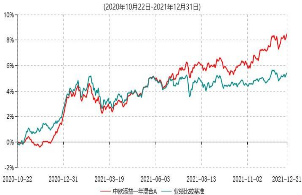
中欧添益一年混合A累计净值增长率与业绩比较基准收益率历史走势对比图

注：本基金基金合同生效日期为 2020 年 10 月 22 日，按基金合同的规定，本基金自基金合同生效起六个月为建仓期，建仓期结束时各项资产配置比例已符合基金合同约定。