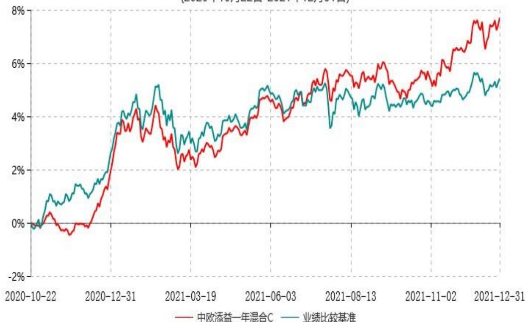
中欧添益一年混合C累计净值增长率与业绩比较基准收益率历史走势对比图 (2020年10月22日-2021年12月31日)

注：本基金基金合同生效日期为2020年10月22日，按基金合同的规定，本基金自基金合同生效起六个月为建仓期，建仓期结束时各项资产配置比例已符合基金合同约定。