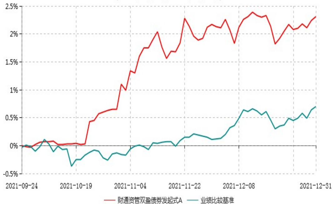
财通资管双盈债券发起式A累计净值增长率与业绩比较基准收益率历史走势对比图 (2021年09月24日-2021年12月31日)