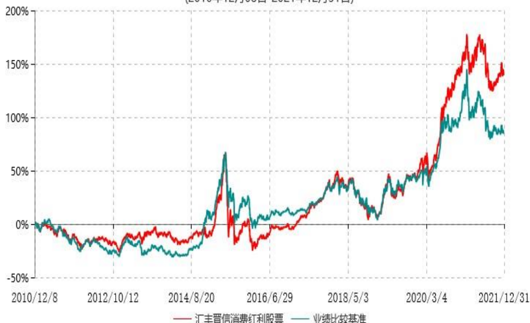
汇丰晋信消费红利股票型证券投资基金累计净值增长率与业绩比较基准收益率历史走势对比图 (2010年12月08日-2021年12月31日)

注：1. 按照基金合同的约定，本基金的投资组合比例为：股票投资比例范围为基金资产的85%-95%，权证投资比例范围为基金资产净值的0%-3%。固定收益类证券、现金和其他资产投资比例范围为基金资产的5%-15%，其中现金（不包括结算备付金、存出保证金、应收申购款等）或到期日在一年以内的政府债券的投资比例不低于基金资产净值的5%。按照基金合同的约定，本基金自基金合同生效日起不超过6个月内完成建仓，截止2011年6月8日，本基金的各项投资比例已达到基金合同约定的比例。