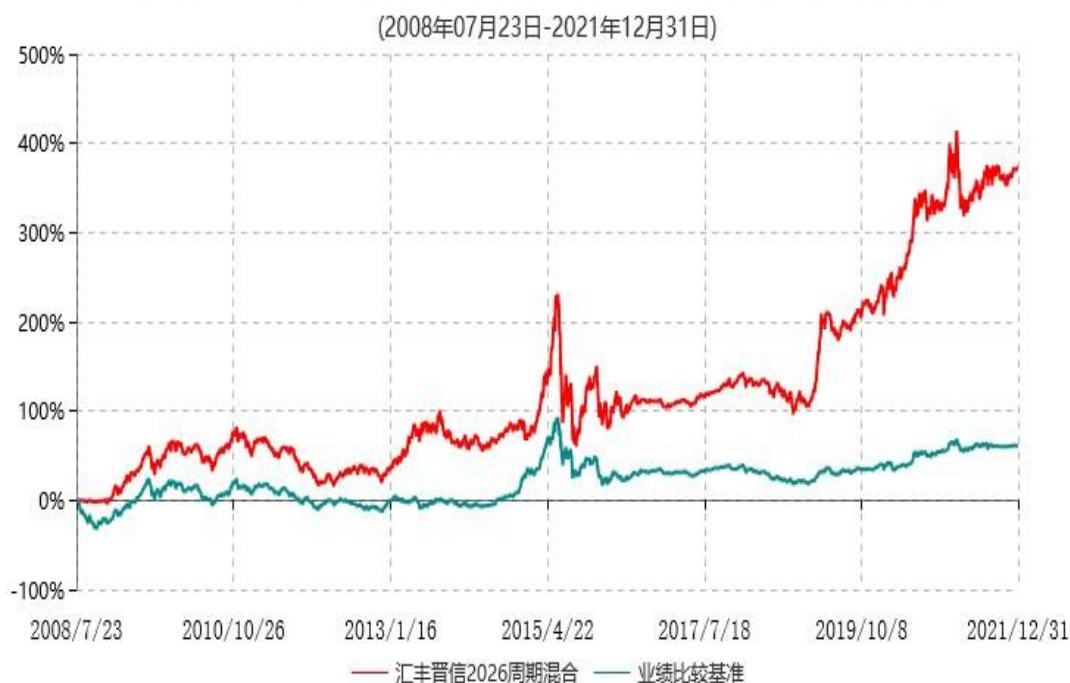
汇丰晋信2026生命周期证券投资基金累计净值增长率与业绩比较基准收益率历史走势对比图