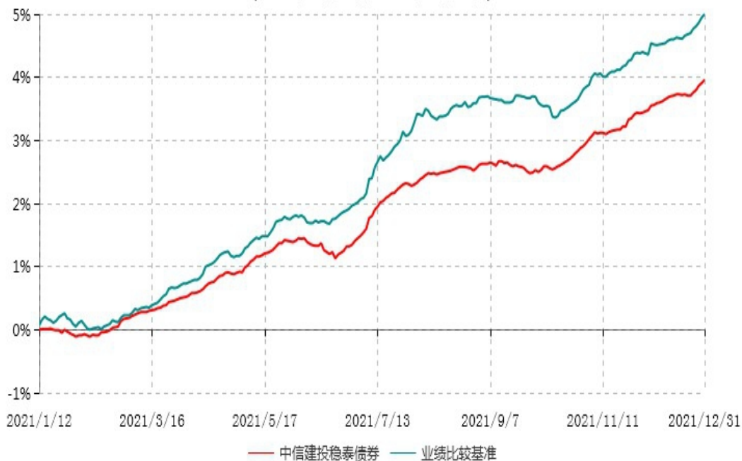
中信建投稳泰一年定期开放债券型发起式证券投资基金累计净值增长率与业绩比较基准收益率历史走势对比图 (2021年01月12日-2021年12月31日)

注：1、本基金基金合同生效于2021年1月12日，截至报告期末本基金基金合同生效未满一年。