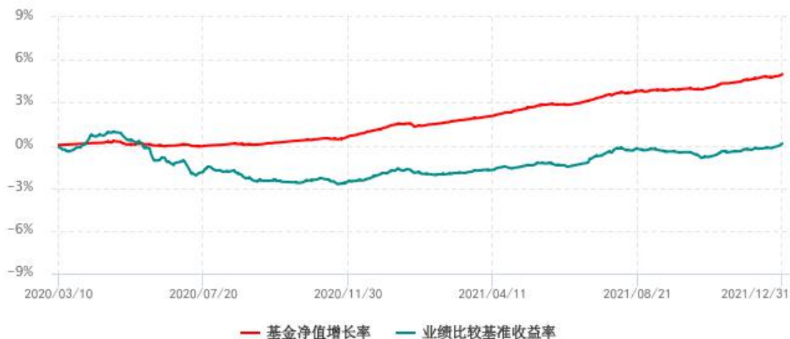
基金份额累计净值增长率与同期业绩比较基准收益率历史走势对比图 (2020年03月10日-2021年12月31日)

注：1、本基金成立于 2020 年 3 月 10 日；2、比较基准：中债综合全价(总值)指数收益率。