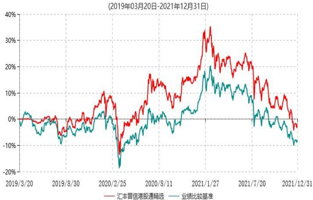
汇丰晋信港股通精选股票型证券投资基金累计净值增长率与业绩比较基准收益率历史走势对比图