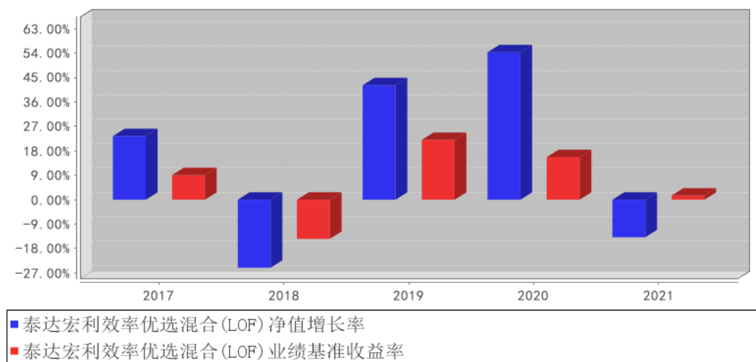
泰达宏利效率优选混合(LOF)基金每年净值增长率与同期业绩比较基准收益率的对比图