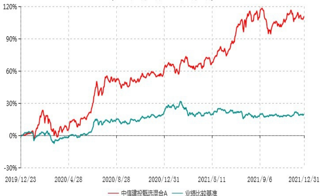
中信建投甄选混合A累计净值增长率与业绩比较基准收益率历史走势对比图 (2019年12月23日-2021年12月31日)