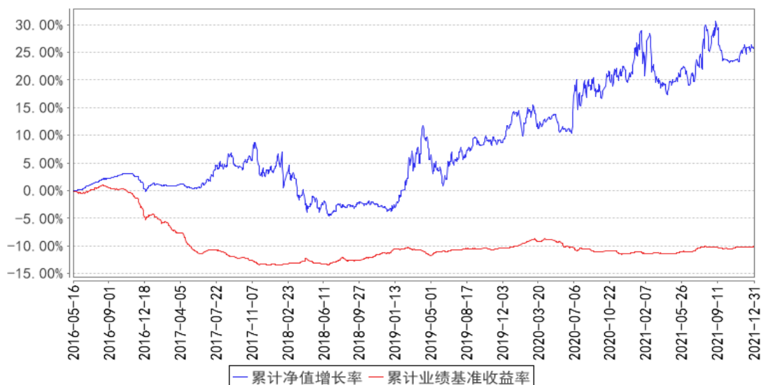
泰达宏利聚利债券（LOF）累计净值增长率与同期业绩比较基准收益率的历史走势对比图

注：本基金在建仓期结束时及截止报告期末各项投资比例已达到基金合同规定的比例要求。