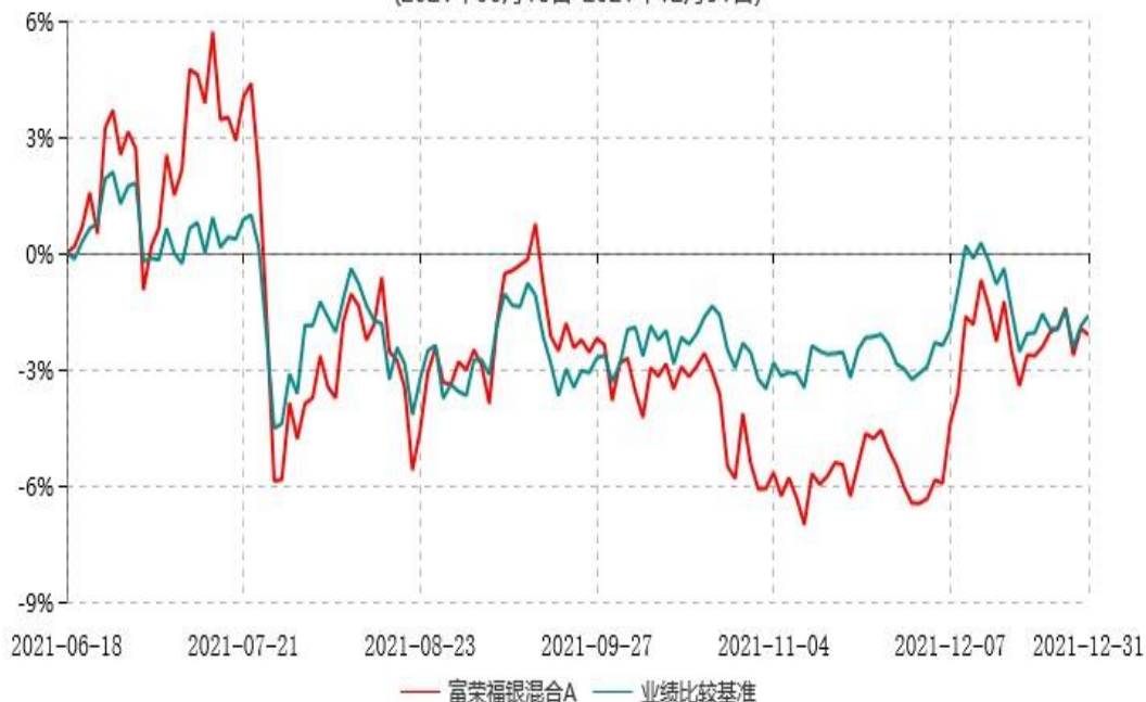
富荣福银混合C累计净值增长率与业绩比较基准收益率历史走势对比图