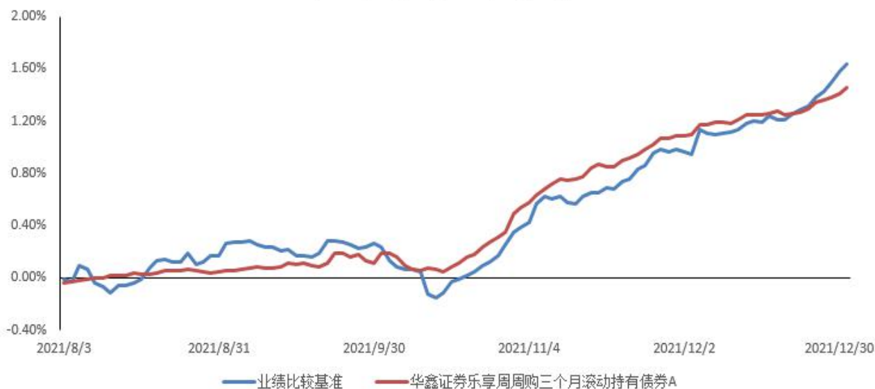
华鑫证券乐享周周购三个月滚动持有债券A累计净值增长率与业绩比较基准收益率历史走势对比图 (2021年08月03日-2021年12月31日)