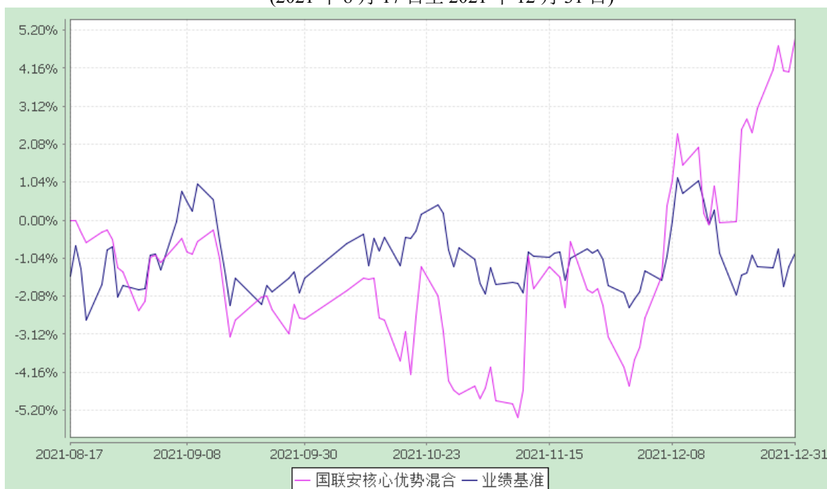
自基金合同生效以来份额累计净值增长率与业绩比较基准收益率的历史走势对比图 (2021 年 8 月 17 日至 2021 年 12 月 31 日)

注：1、本基金业绩比较基准为沪深 300 指数收益率*65%+中债综合指数收益率*25%+恒生指数收益率*10%；