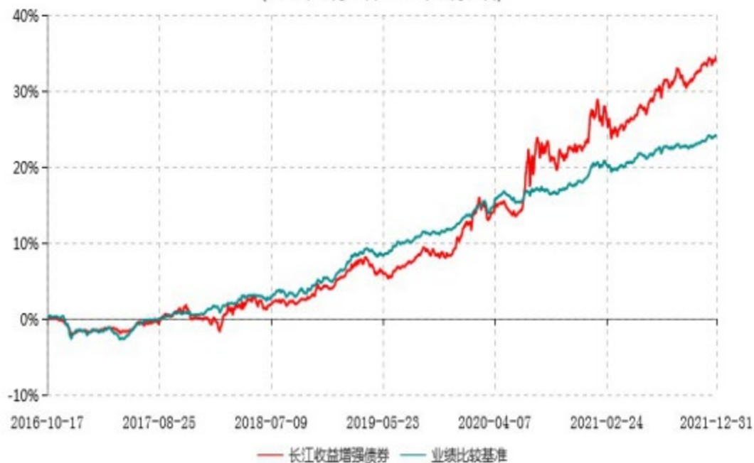
长江收益增强债券型证券投资基金累计净值增长率与业绩比较基准收益率历史走势对比图 (2016年10月17日-2021年12月31日)