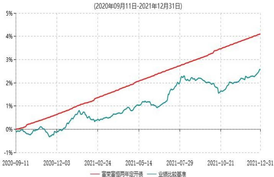
富荣富恒两年定期开放债券型证券投资基金累计净值增长率与业绩比较基准收益率历史走势对比图