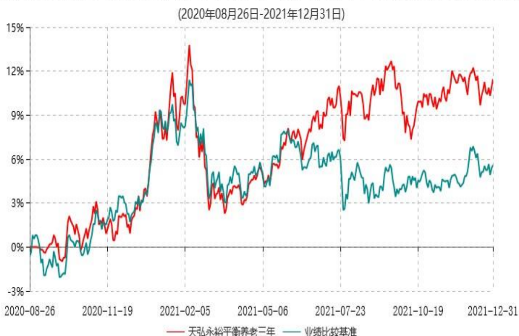
天弘永裕平衡养老目标三年持有期混合型发起式基金中基金(FOF)累计净值增长率与业绩比较基准收益率历史走势对比图