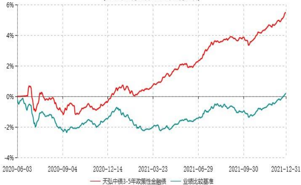
天弘中债3-5年政策性金融债指数发起式证券投资基金累计净值增长率与业绩比较基准收益率历史走势对比图 (2020年06月03日-2021年12月31日)