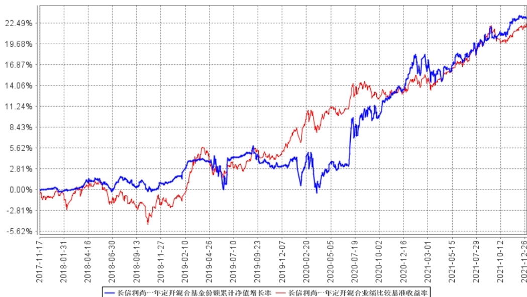
长信利尚一年定开混合基金份额累计净值增长率与同期业绩比较基准收益率的历史走势对比图

注：1、图示日期为 2017 年 11 月 17 日至 2021 年 12 月 31 日。