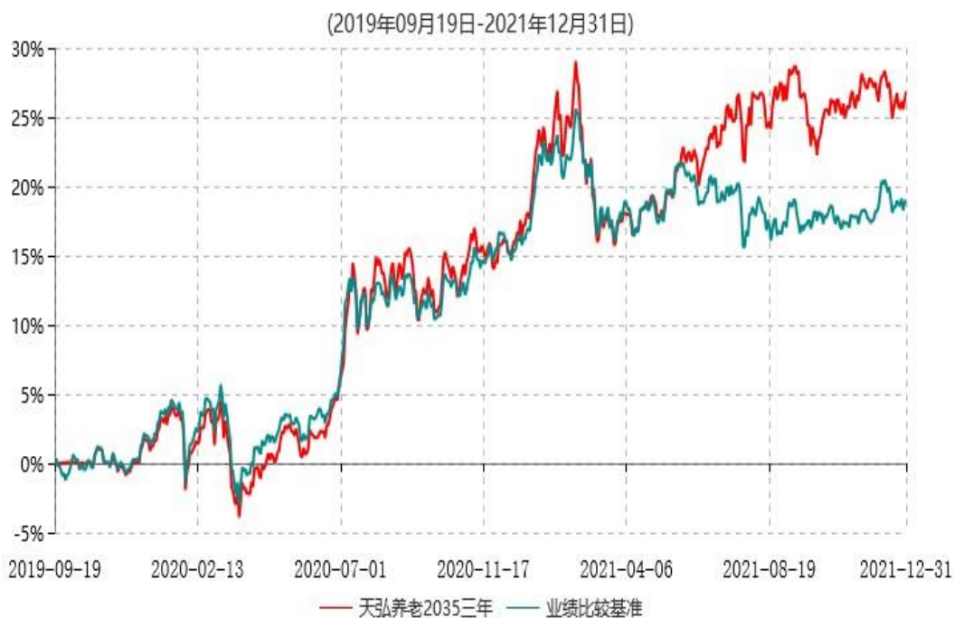
天弘养老目标日期2035三年持有期混合型发起式基金中基金（FOF）累计净值增长率与业绩比较基准收益率历史走势对比图