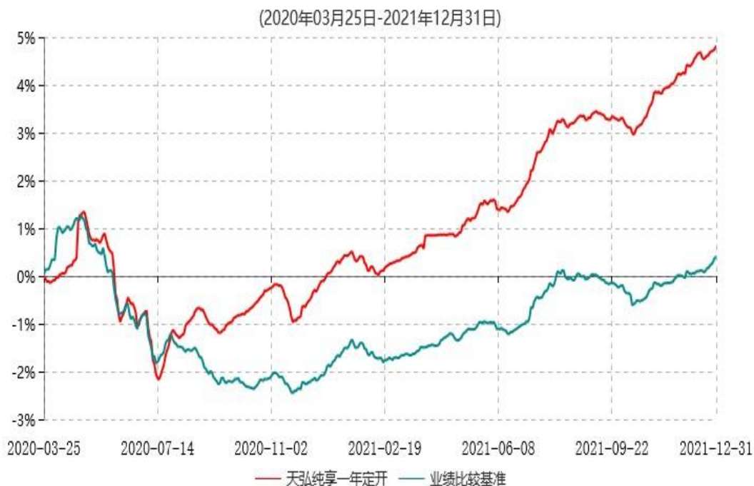
天弘纯享一年定期开放债券型发起式证券投资基金累计净值增长率与业绩比较基准收益率历史走势对比图